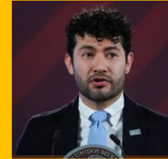
Marath Bolaños López Secretario del Trabajo y Previsión Social (STPS)