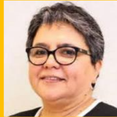
Raquel Buenrostro Sánchez Secretaria de Economía