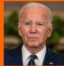
Joseph R. Biden Presidente de Estados Unidos