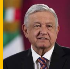
Andrés Manuel López Obrador Presidente de la República