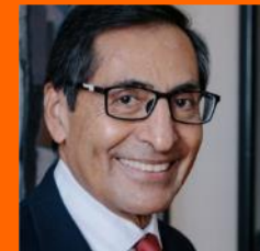
Rogelio Eduardo Ramírez de la O Secretario de Hacienda y Crédito Público (SHCP)