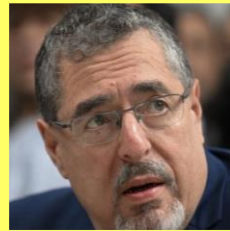
Bernardo Arévalo Presidente electo de Guatemala