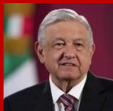
Andrés Manuel López Obrador Presidente de la República