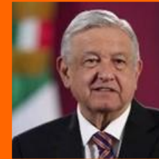
Andrés Manuel López Obrador Presidente de México