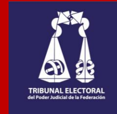
Tribunal Electoral del Poder Judicial de la Federación (TEPJF)