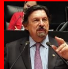
Napoleón Gómez Urrutia Senador (Morena), secretario general del Sindicato Nacional de Mineros y presidente de la Confederación Internacional de Trabajadores (CIT)