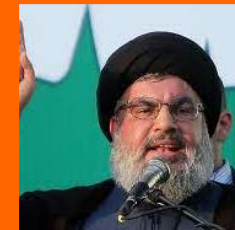
Hasan Nasrallah Secretario General de Hezbollah