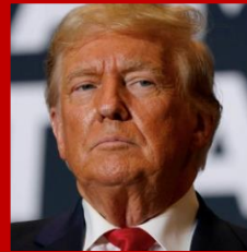
Donald Trump Aspirante a candidato presidencial de Estados Unidos