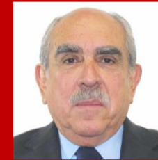
Pablo Gómez Álvarez Titular de la Unidad de Inteligencia Financiera (UIF)