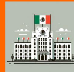
Organismos administrativos Instituto Nacional de Migración (INM) /Conagua