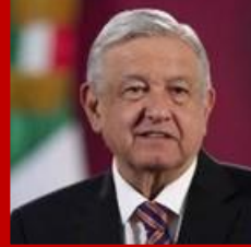
Andrés Manuel López Obrador Presidente de la República