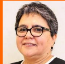
Raquel Buenrostro Sánchez Secretaría de Economía