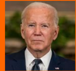
Joseph R. Biden Presidente de Estados Unidos