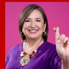
Bertha Xóchitl Gálvez Ruiz Candidata presidencial de PAN-PRI-PRD