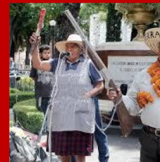
Campeños y pobladores Grupos civiles