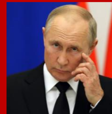
Vladimir Putin Presidente de Rusia