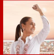
Claudia Sheinbaum Pardo Candidata presidencial de Morena-PT-PVEM