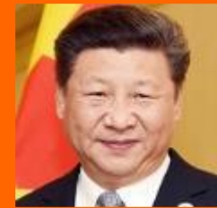
Xi Jinping Presidente de China