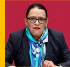
Rosa Icela Rodríguez Velázquez Secretaria de Seguridad y Protección Ciudadana