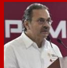
Octavio Romero Oropeza Director general de Petróleos Mexicanos (Pemex)