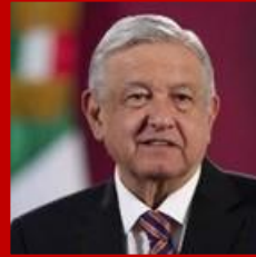
Andrés Manuel López Obrador Presidente de la República