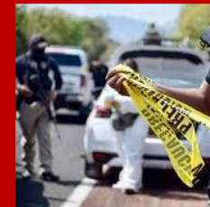
Grupos criminales locales Crimen organizado