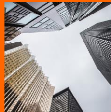
Empresarios Sector Privado