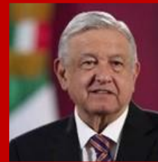
Presidente de la República Andrés Manuel López Obrador