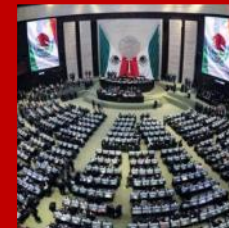
Congreso de la Unión