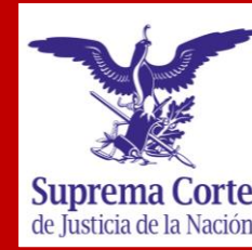
Suprema Corte de Justicia de la Nación (SCJN)