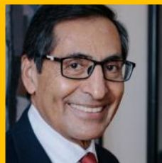
Rogelio Eduardo Ramírez de la O Secretario de Hacienda y Crédito Público (SHCP)