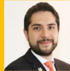
Antonio Martínez Dagnino Titular del Servicio de Administración Tributaria (SAT)