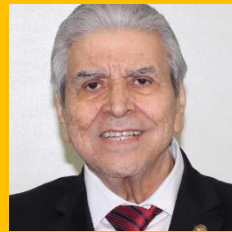
Carlos Aceves del Olmo Secretario general de la Confederación de Trabajadores de México (CTM)