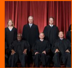
Corte Suprema de los Estados Unidos