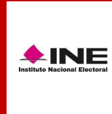
Instituto Nacional Electoral (INE)