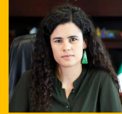
Luisa María Alcalde Luján Secretaria de Gobernación