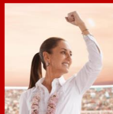
Claudia Sheinbaum Pardo Candidata presidencial de Morena-PT- PVEM