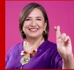
Bertha Xóchitl Gálvez Ruiz Candidata presidencial de PAN-PRI-PRD