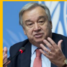
Antonio Guterres Secretario General de Naciones Unidas