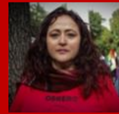
Susana Prieto Terrazas Diputada federal (Morena) y líder sindical